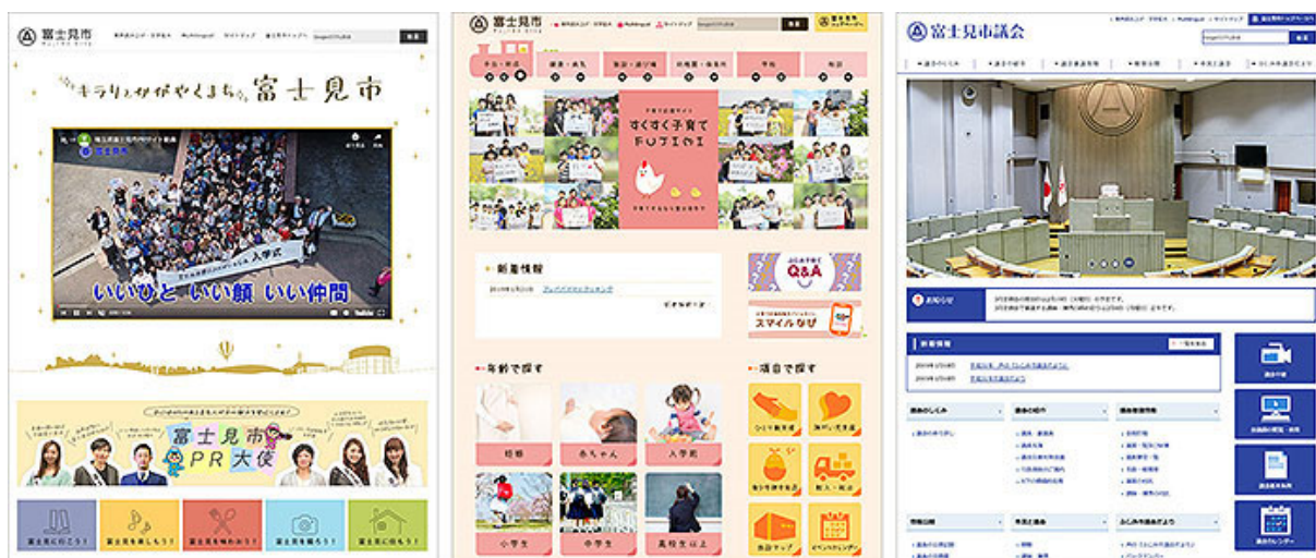
左:PR サイト画面 中:子育て応援サイト画面 右:市議会サイト画面