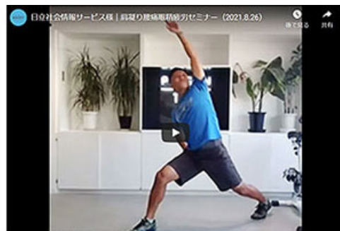
さまざまな健康状態の従業員が参加した麒麟ビバレッジ主催の健康セミナー（一例）