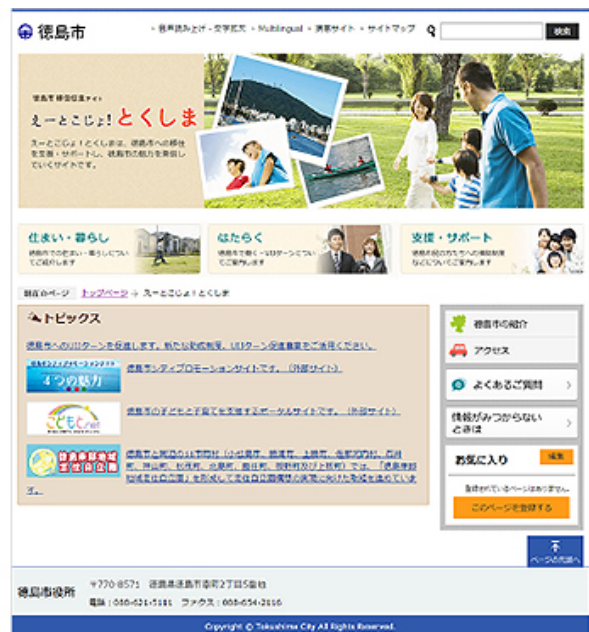
左:「観光・文化」トップページ画面 右:「えーとこじょ! とくしま」トップページ画面