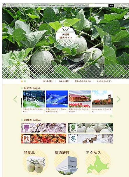
夕張市らしさを引き出した「夕張市観光サイト」トップページデザイン