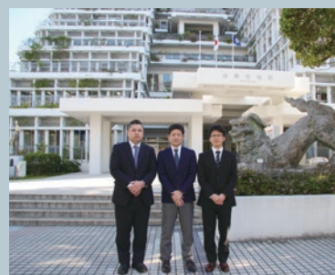
那覇市 秘書広報課 様

沖縄県の県都・那覇市は、海外交易の拠点として「琉球王国」文化が華ひらいた街として知られています。先の大戦では焦土と化しましたが、1972年の日本復帰を経て、人口32万人余を有する大都市へと発展しました。