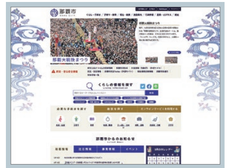
那覇市公式サイト https://www.city.naha.okinawa.jp/

そこで、那覇市様は2019年3月にホームページをリニューアルし、操作性の高いCMSを導入したことで、サイト全体のページレイアウトの統一、マルチデバイスへの最適化など円滑な情報発信を実現しています。またリニューアル公開後も、災害時に備えたコンテンツの切替準備など、サイト運営に関する継続的な施策に取り組んでいます。